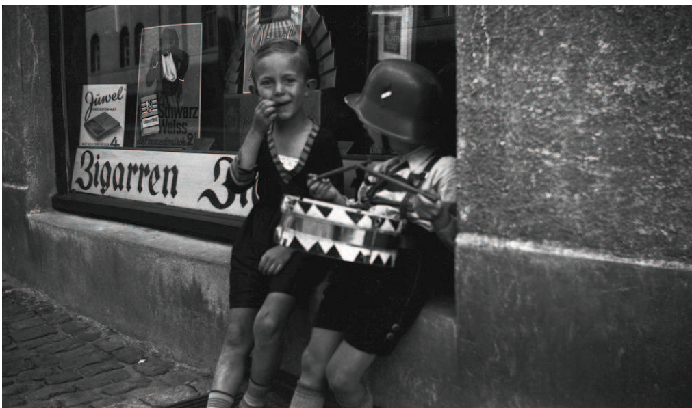
Peltirumpu Berliinissä 1936

Ensimmäinen valokuva julkaistiin Helsingin Sanomissa 1904.