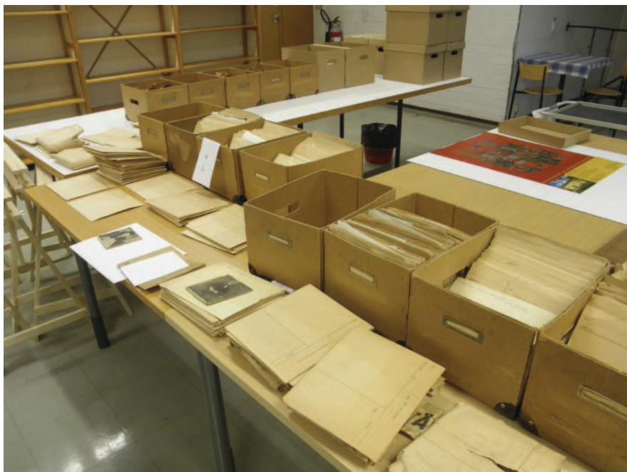
Maaseudun Tulevaisuuden laatikoita Museovirastossa Nervanderinkadulla