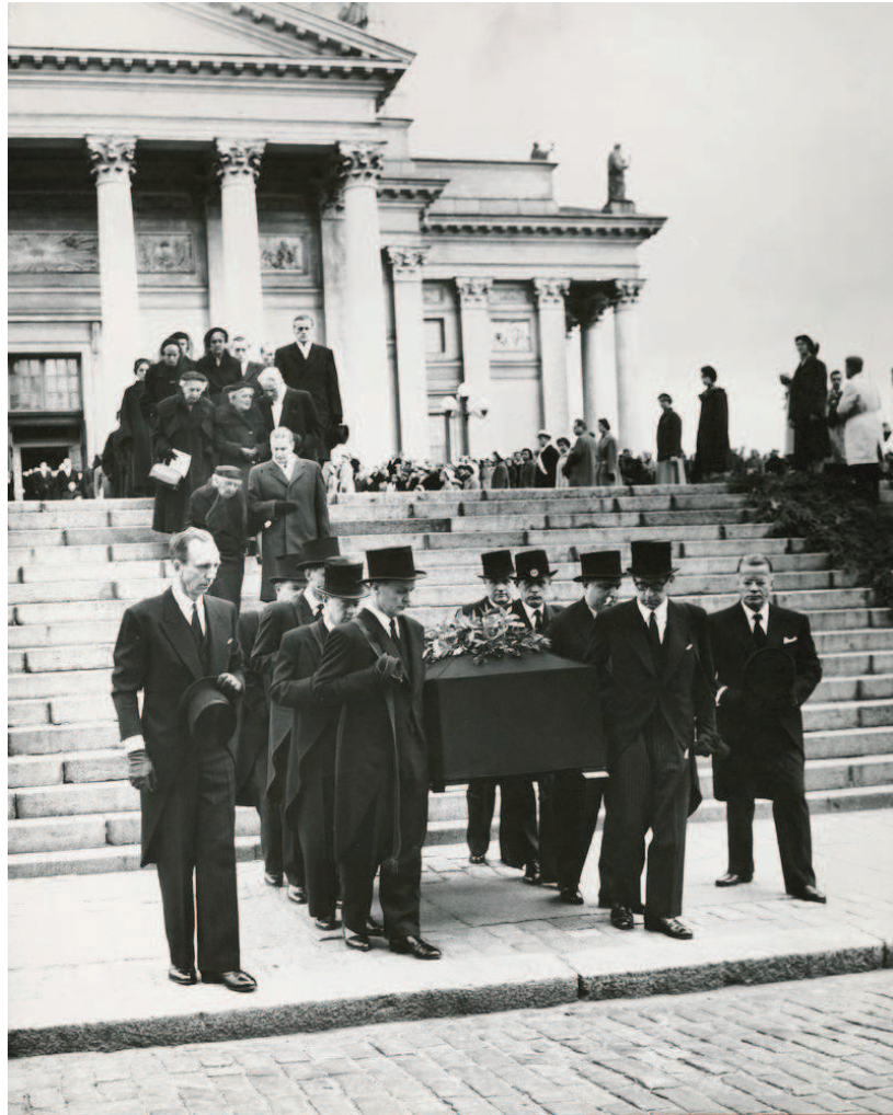
Sibeliuksen hautajaiset 30.9.1957